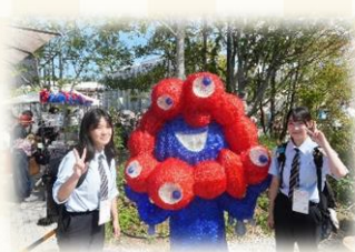
▲みらい甲子園全国発表会