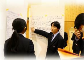
▲プレ課題研究ポスターセッション (1年次)