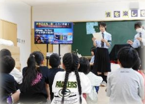
▲浦小での防災マスターによる講座