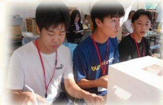
▲港まつりボランティア