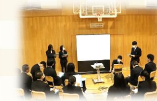
▲課題研究年次発表 (2年次)