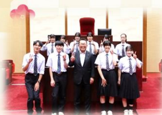
▲小倉南高校交流事業