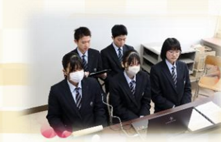
▲tan-fest in 胆振・日高