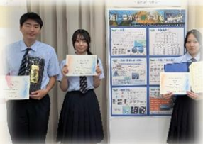
▲マリンチャレンジプログラム (2月全国大会へ)