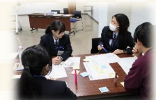
▲SDGs ワーキンググループ