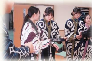
▲アイヌと台湾先住民族交流事業