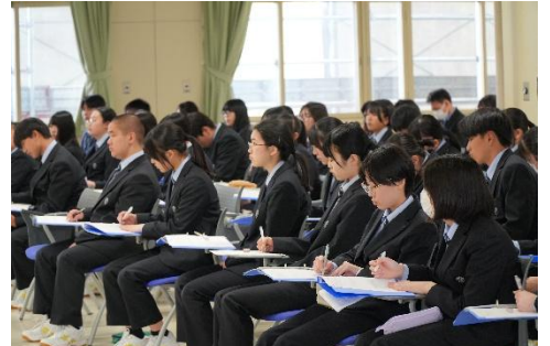
真剣に聴いています！